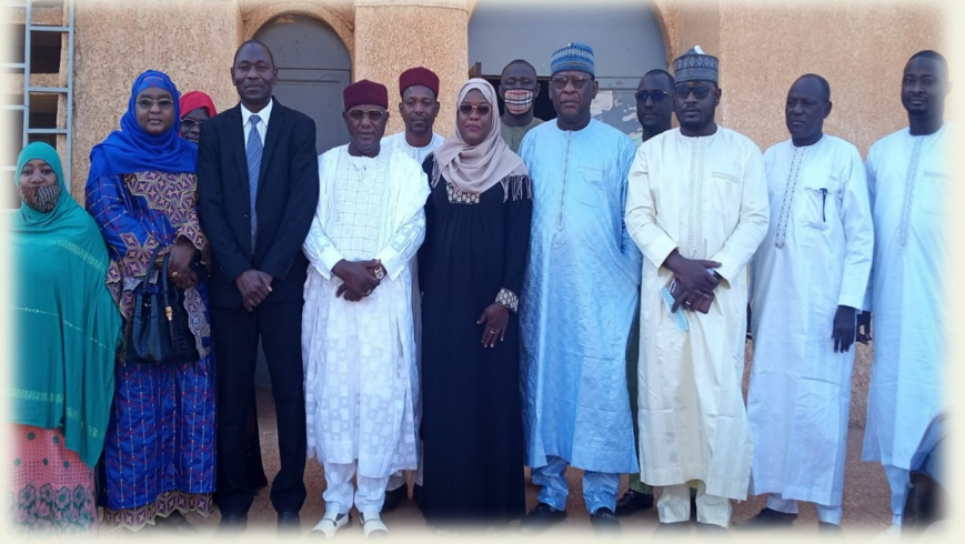
Photo de famille après la cérémonie de prestation de Serment

Toujours dans le cadre de son plan d'actions les activités suivantes ont été réalisées: