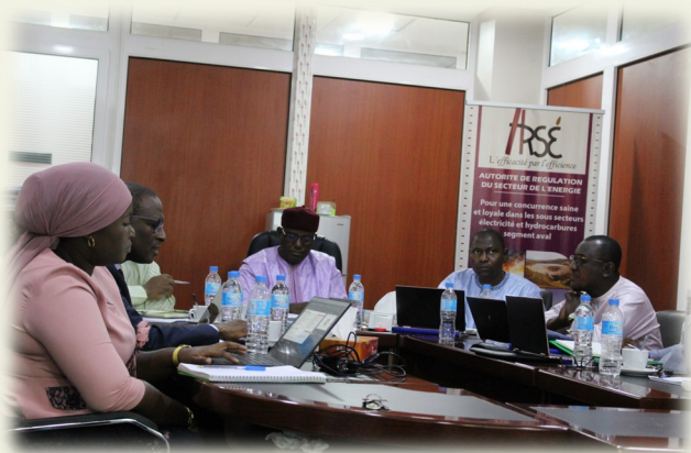
Vue de la salle

Deux (02) jours durant, les participants ont examiné le rapport et formulé des critiques et des observations pertinentes. Le dépôt par le Consultant, de la Version finale du rapport sur la politique générale de régulation et le Plan stratégique 2022-2026, est prévu pour octobre 2022.