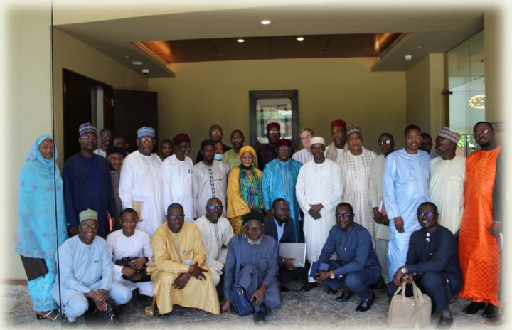
Photo de famille à l'Atelier