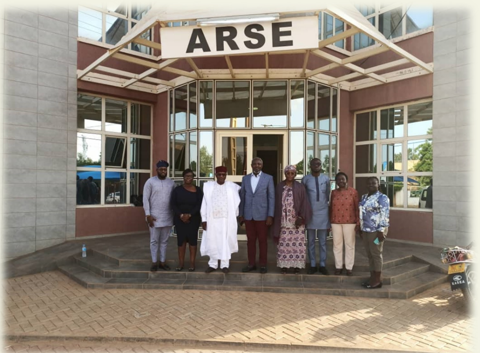
Photo de Famille : Délégation de NPA Ghana et deux représentants de l’ARSE

Au vu de l’expérience de la NPA, créée en 2005, il a été convenu d’une visite de travail de l’ARSE dans leurs locaux, à l’occasion de l’atelier qui sera organisé par l’ARDA dans les semaines à venir, à ACCRA.