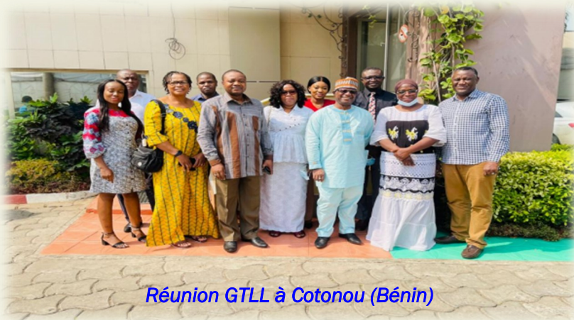
Réunion GTLL à Cotonou (Bénin)

A l'issu des différents échanges entre les experts du GTLL et la Consultante recrutée par l'ARREC pour proposer des lignes directrices ainsi que les modèles de licences, un projet de Directive pour l'harmonisation des critères d'octroi de licences et d'autorisation pour les participants au Marché Régional de l'Electricité de la CEDEAO ainsi que les projets de modèles de licences d'importation et d'exportation ont été conçus et transmis à l'ARREC pour validation.