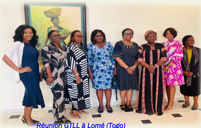
Réunion GTLL à Lomé (Togo)