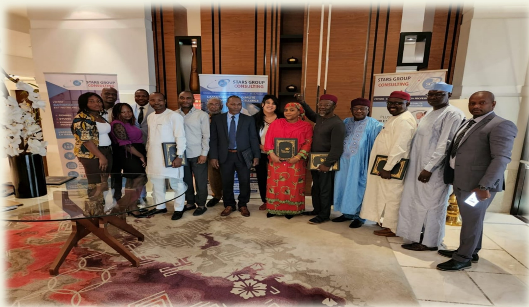
Photo de Famille de la formation