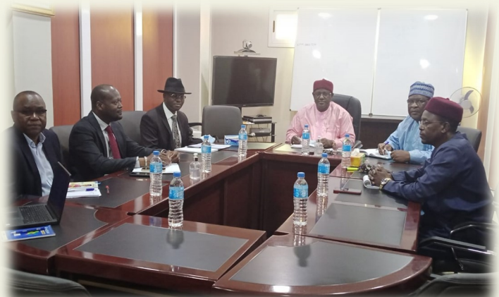
Vue de la rencontre ARSE- Banque Mondiale