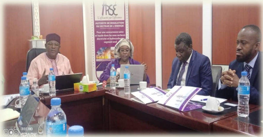
Vue de la Rencontre avec la délégation de l'ARREC

Dans sa volonté d'appuyer aux renforcements des capacités des régulateurs nationaux, l'ARREC a initié un programme de jumelage entre autori-