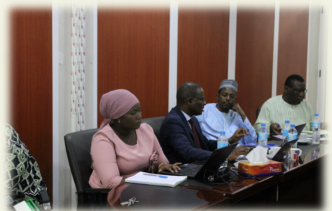
Vue de la salle