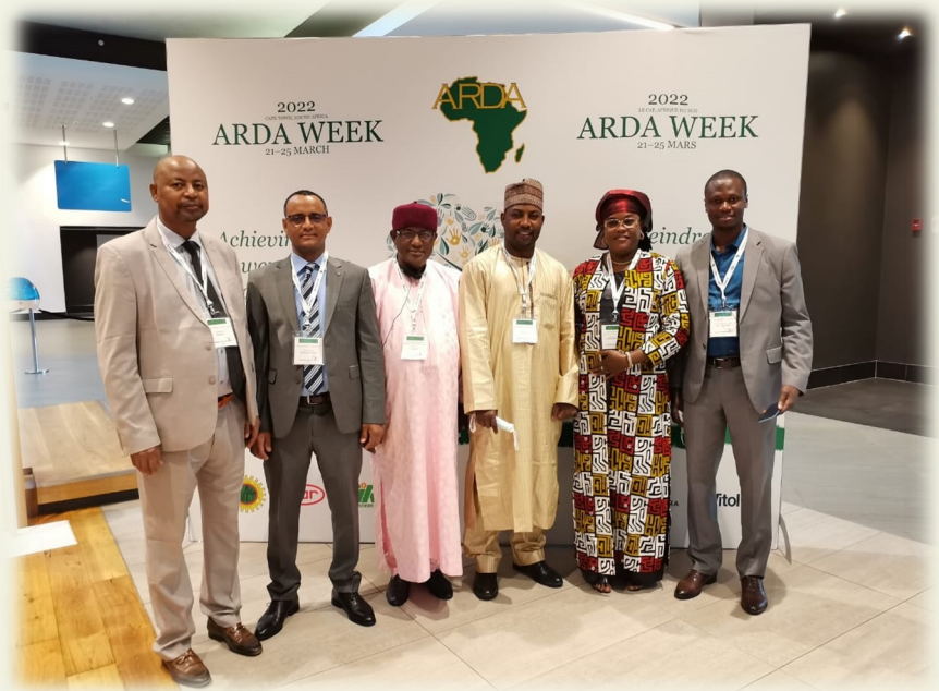
Délégation du Niger à l'ARDA WEEK 2022 à Cap Town