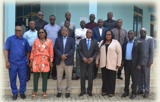
Rencontre des Experts en Communication de l'ARREC