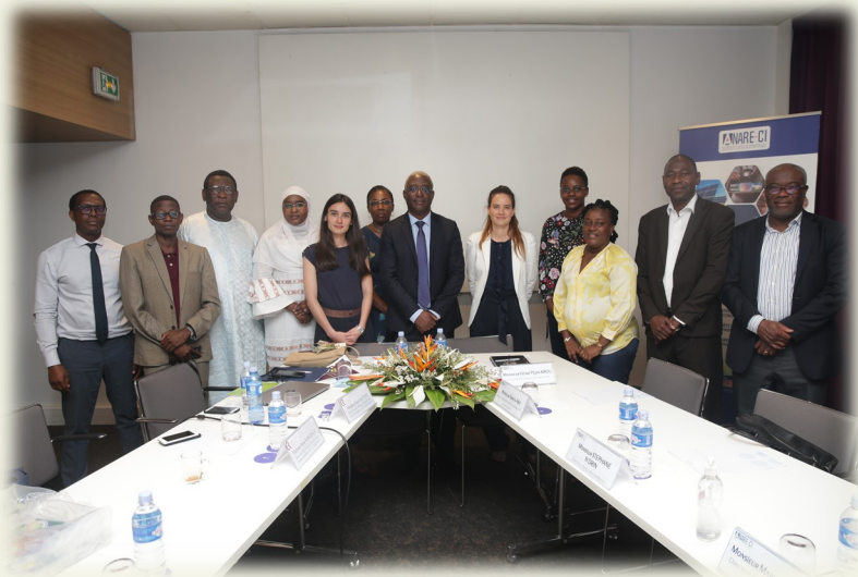
Photo de famille de la Mission

Cette mission d'une semaine a permis des échanges croisés entre les trois régulateurs, permettant à chacun d'apporter des perspectives et des expériences différentes sur les thématiques abordées.