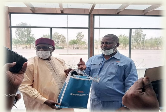
Le D.G.A SORAZ remettant un souvenir au D.G ARSE

La délégation de l'ARSE est repartie satisfaite de la mission globale d'une part et du niveau stable de la production de la SORAZ .