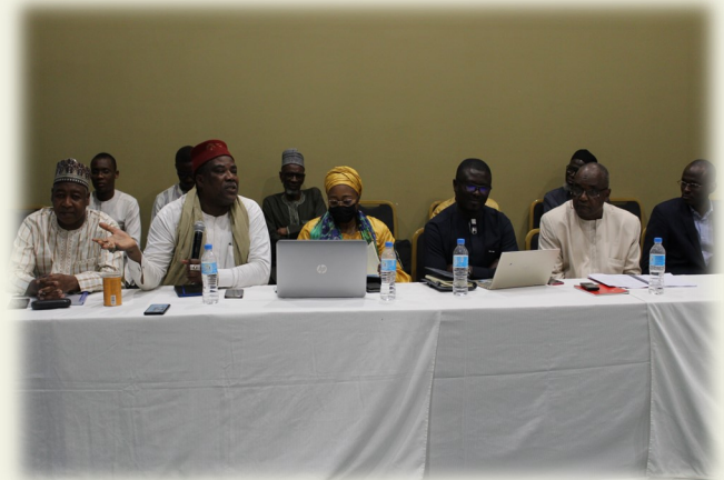
Participants à l'Atelier