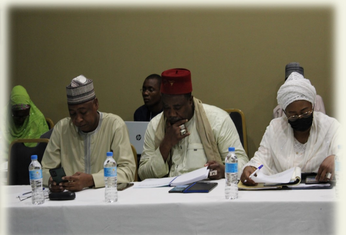
Vue des participants à l'atelier de Restitution de l'étude Tarifaire 2023-2027