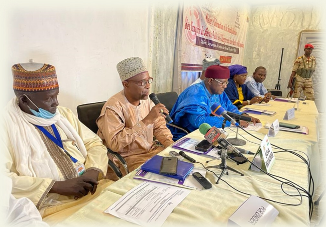
Table de séance: Atelier Zinder

Les thématiques présentées sont les mêmes que celles présentées à l'atelier de Niamey et de Tahoua