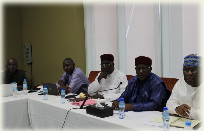
Participants Atelier Etudes tarifaires

Cette nouvelle révision des tarifs impliquera une analyse critique de la structure existante, un nouveau calcul exhaustif à partir de toutes les prévisions de demande, de