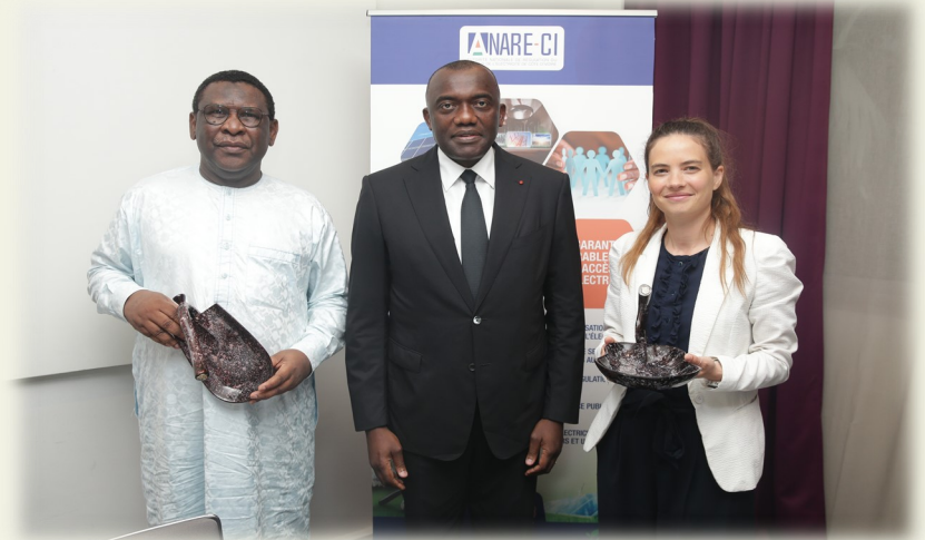
DSE ARSE, DG ANARE-CI et D.adj. DAEIC-CRE