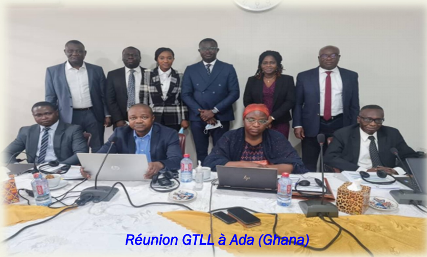
Réunion GTLL à Ada (Ghana)