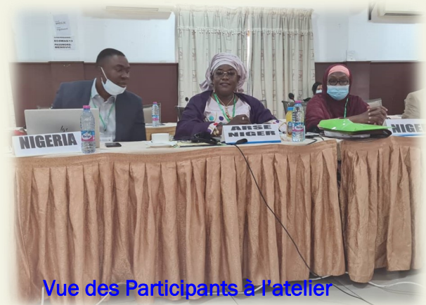
Vue des Participants à l'atelier

Un an plutôt en prélude à cette validation , la Commission de la CEDEAO, a organisé du 14 au 15 décembre 2021, à Abidjan en Côte d'Ivoire, un atelier régional de validation du projet de rapport de collecte de données et de diagnostic relatif à l'étude pour l'élaboration du Code Pétrolier Régional de