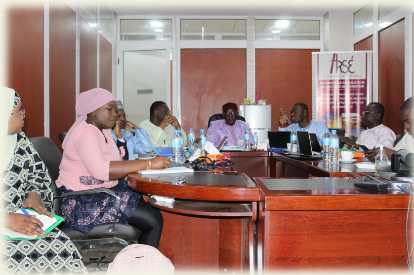
Participants à la restitution de l'étude sur le Plan Stratégique 2023-2027

Dans le cadre de la révision de la Politique Générale de Régulation et l'élaboration du plan stratégique 2022-2026 de l'ARSE , un atelier de présentation du rapport provisoire global d'analyse s'est tenu les 18 et 19 août 2022 dans la Salle de réunion de l'ARSE.