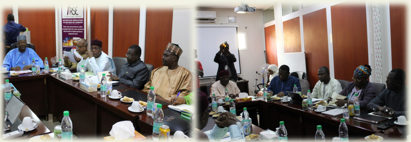
Vue de la rencontre ARSE— Commission de Finances de l'Assemblée Nationale

Plusieurs questions ont été posées par les honorables députés que le Directeur Général de l'ARSE et son équipe ont tenu à apporter les réponses appropriées.