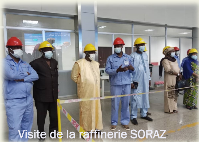
Visite de la raffinerie SORAZ

Cette visite a permis aux responsables de la SORAZ et de l'ARSE d'échanger sur des points importants concernant la relation entre les deux structures : l'évolution actuelle de production, l'équilibre financier de la SORAZ, l'impact de la covid 19 sur les activités de SORAZ, les difficultés de l'entreprise, le problème