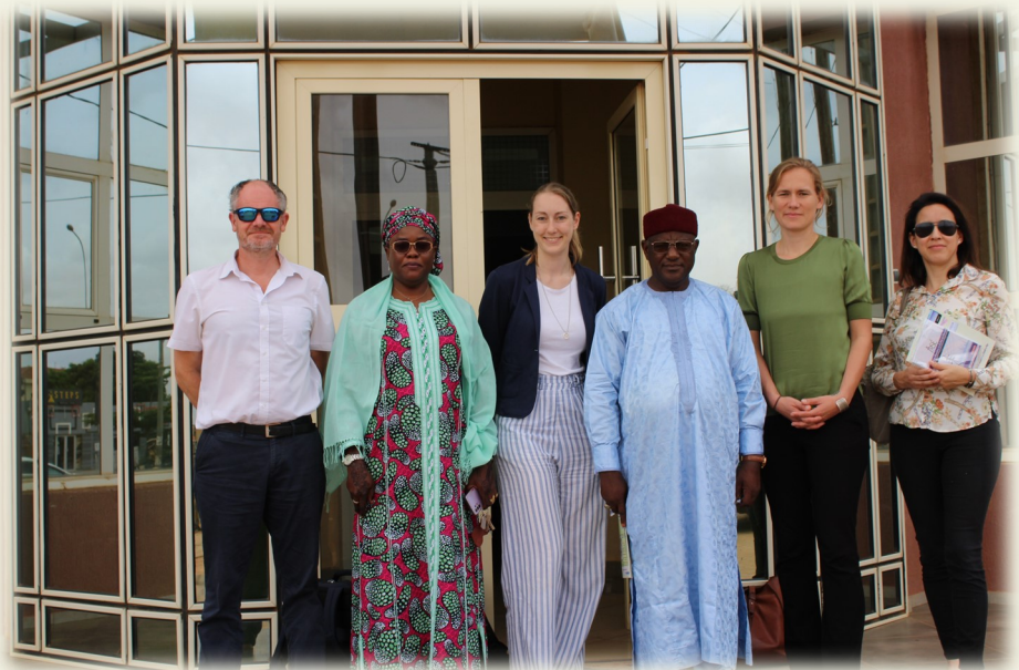
Photo de famille avec la délégation du GIZ

La mission a promis de revenir au cours du mois de décembre pour une meilleure implication.