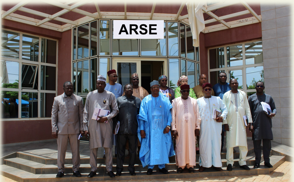
Photo de la famille avec la délégation de la Commission de Finances de l'Assemblée Nationale