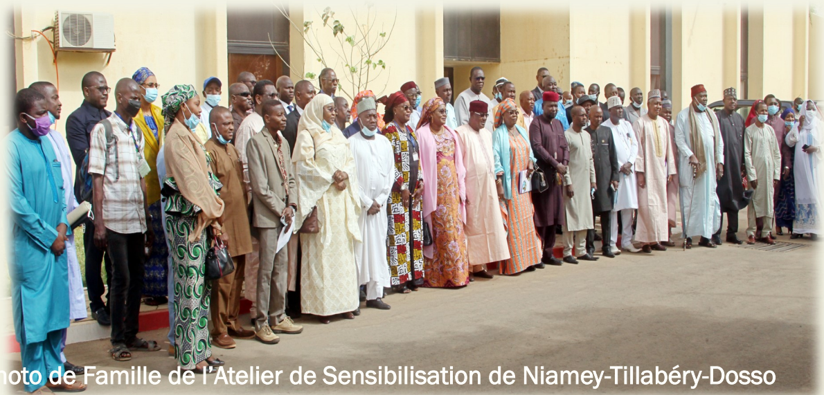
Photo de Famille de l'Atelier de Sensibilisation de Niamey-Tillabéry-Dosso

En plus des thématiques présentées, les participants ont eu droit à des animations audio-visuelles notamment sur la présenta-