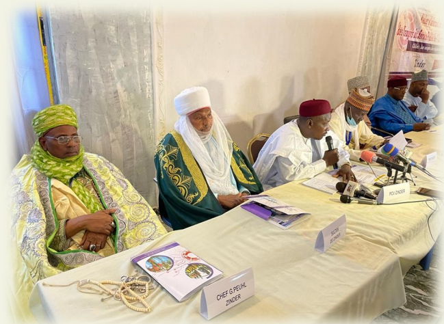
Table de séance: Atelier Zinder