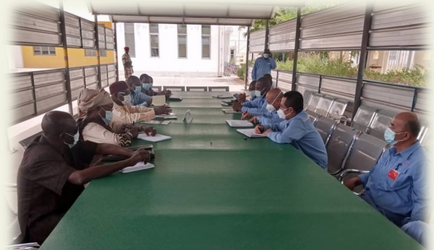
Rencontre avec les dirigeants de la SORAZ

⇒ la salle de commande de la raffinerie ;