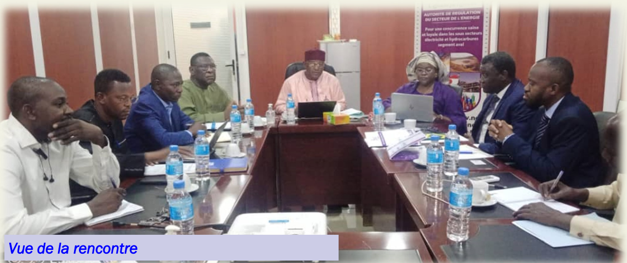
Vue de la rencontre

L'objectif de cette visite est de parfaire l'étude d'évaluation du besoin en renforcement des capacités du personnel de l'autorité de régulation du Niger. La délégation a eu une séance de travail avec l'ensemble du personnel. Pour mieux apprécier leur qualification et expériences et en même temps connaître leur attente, les deux missionnaires ont eu des entretiens individuels avec chaque agent.